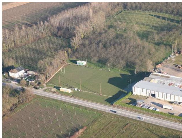
Le terrain de rugby