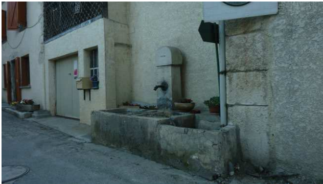
Différents bassins agrémentent l'espace public dont l'alimentation se fait pour la plupart par une source communale