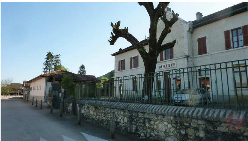
La mairie et le restaurant scolaire depuis la rue principale

Depuis la réalisation du groupe scolaire, les surfaces attribuées à la fonction mairie (secrétariat, salle du conseil, bureaux ...) peuvent être augmentées et redéployées. Une mise aux normes complète (thermique, électricité, accessibilité, sécurité incendie ...) est envisagée.