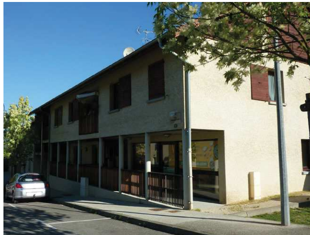
Les logements sociaux avec au rez de chaussée un local commercial