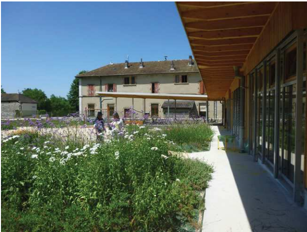
L'école et la mairie depuis la cour

Les bâtiments mairie, école et restaurant scolaire situés en centre-village forment un tout qui permet en creux de distinguer une cour d'école d'un parvis pour la mairie et de circulations de liaisons pour, par exemple, atteindre le restaurant scolaire sans ressortir sur l'espace public. Certains espaces pourraient être reconfigurés (parvis) en complément du bâtiment mairie et le tout doit être pensé comme connecté à la salle polyvalente, au garage communal et à l'esplanade servant aussi de parking (voir ci-après la salle polyvalente et le garage communal ainsi que le chapitre sur les espaces publics spécifiques).