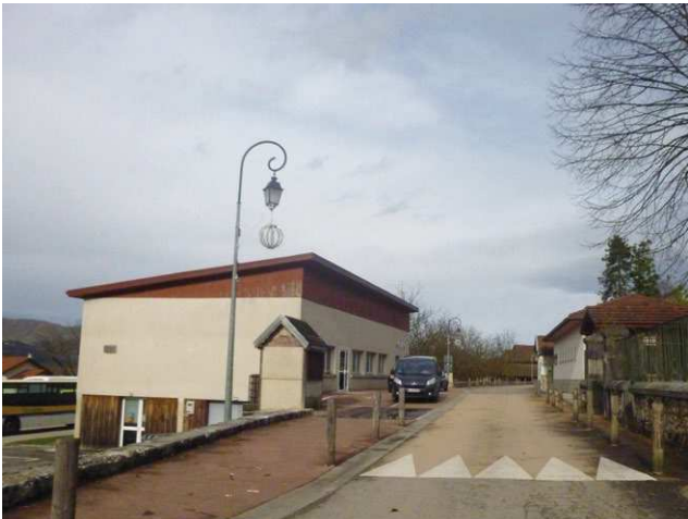
La salle des fêtes depuis la rue principale