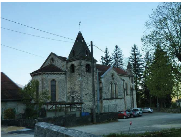
L'église du village

On trouve aussi un espace dédié au sport au village, derrière l'église avec un jeu de boules, des tennis, un terrain multisports et un terrain de sport.