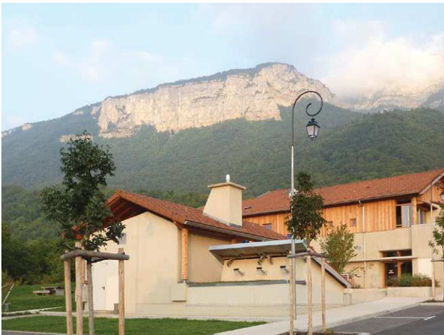
La chaufferie bois qui dessert le restaurant multi-services, les logements sociaux et les gîtes communaux

Au coeur de cette opération on retrouve 12 logements sociaux dont 7 gérés par le bailleur SDH et 5 par Isère Habitat (en accession). Deux gîtes communaux ainsi que deux logements communaux sont aussi présents au sein de cette opération. Il est à noter l'existence d'un local commercial, au rez de chaussée d'une des opérations, en recherche de locataire.