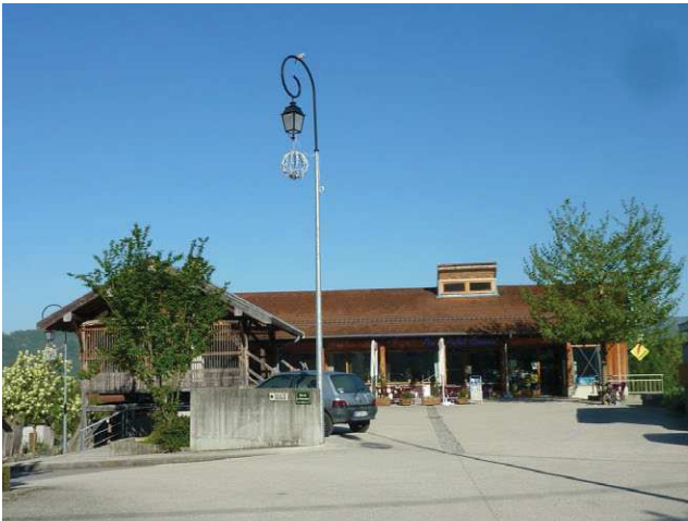
L'espace multi-services et le four à pain en premier plan avec la placette d'accueil