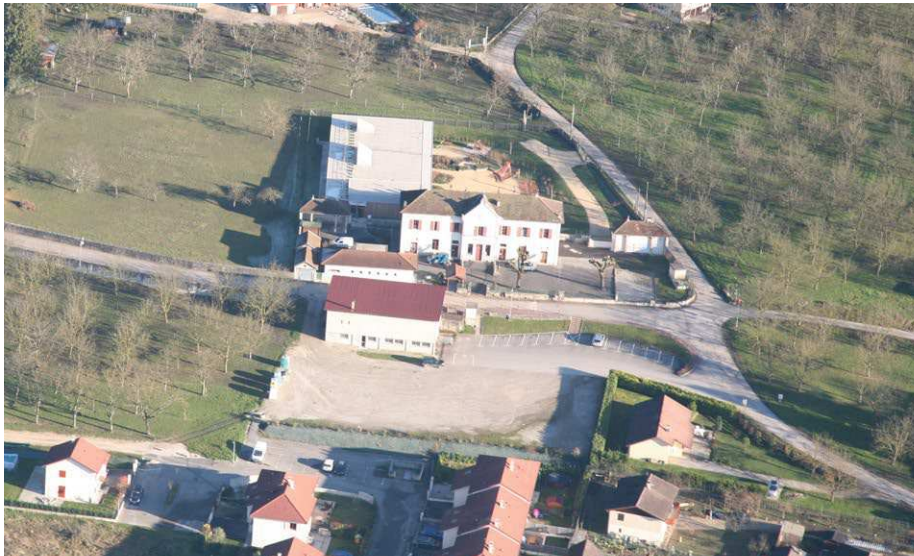
Un espace public central à requalifier