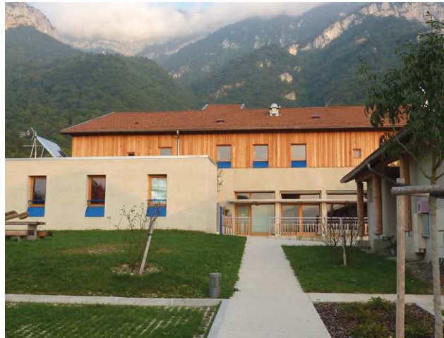
La salle pour les associations, le logement pour le commerçant et la chaufferie bois

Au centre-village, une opération d'ensemble a permis de faire émerger une nouvelle polarité, lieu de vie et de convivialité. L'ensemble est composé d'un restaurant multi-services, de salles associatives, d'un four à pain, d'une chaufferie bois, de logements sociaux et de gîtes communaux (voir aussi les chapitres sur l'habitat et les espaces publics spécifiques).