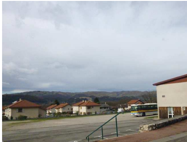
Les garages communaux depuis l'esplanade