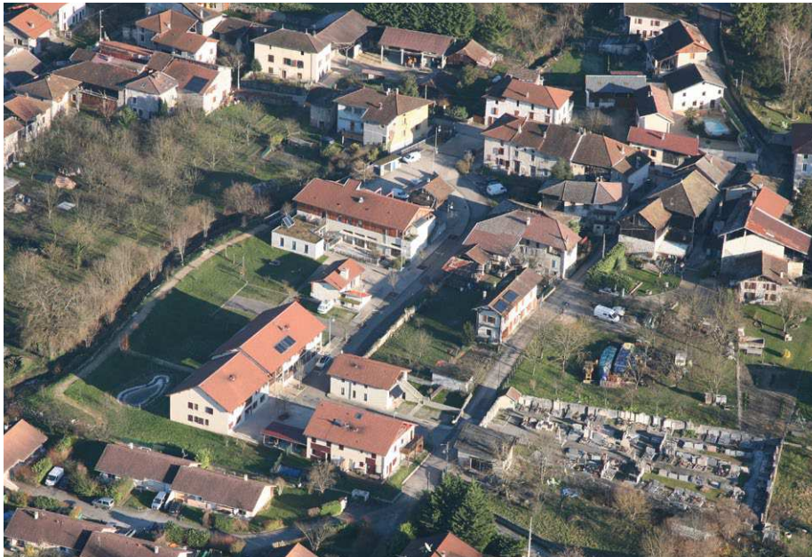
Un espace public central de haute qualité d'usage

Autour du pôle mairie/école/salle des fêtes, l'espace public représente un enjeu fort car c'est un lieu de rencontre important. De plus, il doit accompagner la mutation des terres situées entre lui et le bourg historique. Terres agricoles aujourd'hui enclavées qui vont certainement être le lieu d'un projet urbain constitué autour de la réalisation d'habitat intermédiaire, de la requalification des bâtiments mairie et salle des fêtes et de la mise en lien entre les deux polarités du centre-bourg.