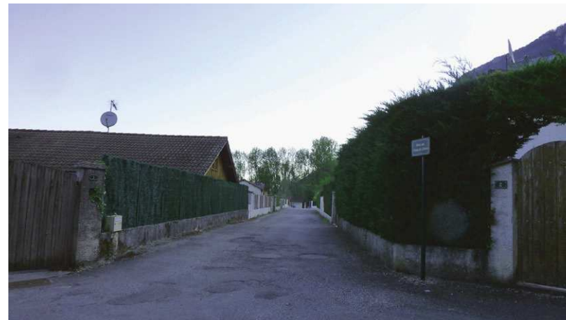
Une rue entièrement dédiée à l'automobile